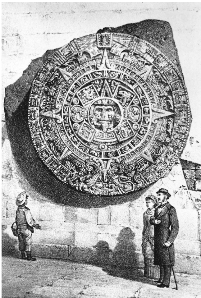
Figura 2. La Piedra del Sol empotrada en la torre poniente de la Catedral. Tomada de la obra de Manuel Rivera Cambas.