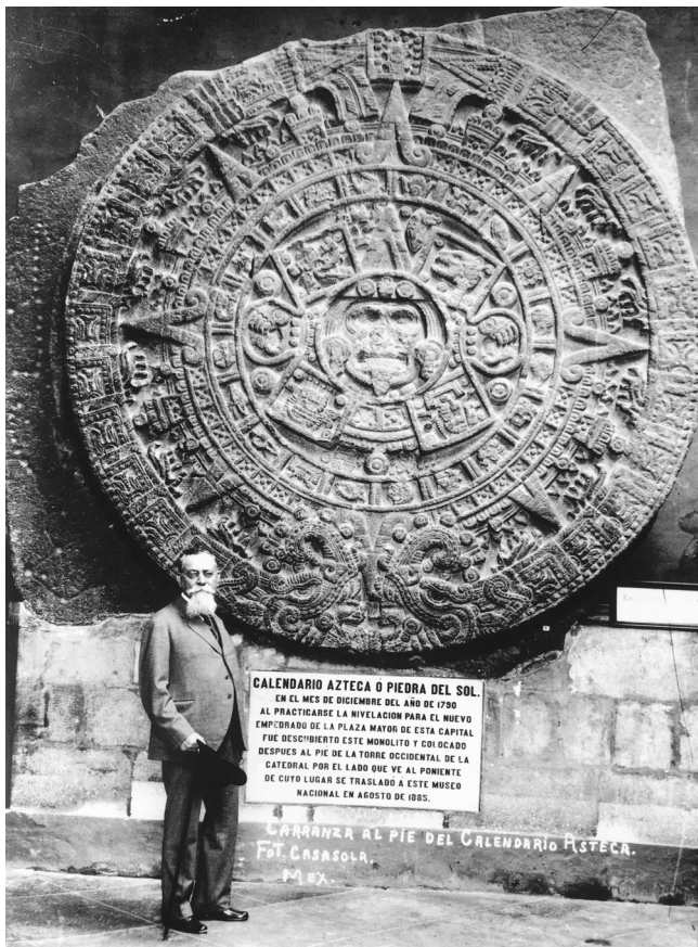
Figura 3. Venustiano Carranza y la Piedra del Sol, c. 1917.